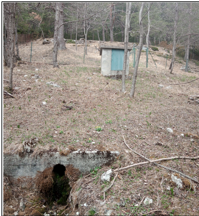
Photo ouvrage source Saint Barbabé 11/04/2022

Système altimétrique : IGN-NGF 69 (précision >5cm) Système planimétrique : RGF93 CC44 (précision >5cm)